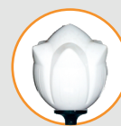
Iris GM/PM, Réf. LM003