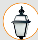
Pyramide, Réf. LM008