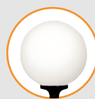
Lina GM/PM, Réf. LM002